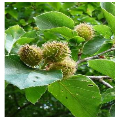
Früchte der Rotbuche

Nicht alle Pflanzen, die ich selber noch nicht bewusst gesehen habe, sind hier selten. Ich habe auch nicht nach ihnen gesucht, nur um meine eigene Liste komplett zu machen.